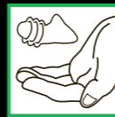
Bild 2 Höger öra